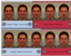
FIG. 2. Afbeelding van trainingsopdrachten met vijf foto's met verschillende van de negatieve interpretatiekas.

Een negatieve interpretatiekas: en nu? Mischel et al. (2014) 5 toonden in een reeks-analyse aan dat patiënten met een borderline persoonlijkheidsstoornis neutrale en ambigue gezichten als negatief interpreteren. Middels een nieuw trainingsprogramma 6 gaan we onderzoeken of we deze bias kunnen verschuiven en wat hiervan het effect is op de sociale relaties in het dagelijks leven van patiënten met een Bps.